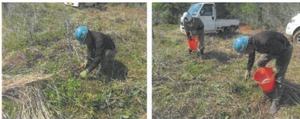
（慶佐次造林クヌギ施肥・下刈り）