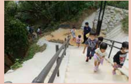
新設された川田避難経路

避難訓練の経験を活かし、日頃から家族と防災について話し合い、備蓄品の準備や、地域との協力で、自然災害に備えましょう。