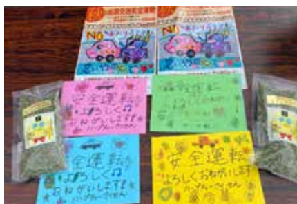
交通安全ハーブティー作戦