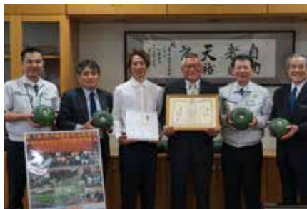
野菜産地活動表彰伝達（かぼちゃ）