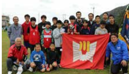
第48回東村新春駅伝大会