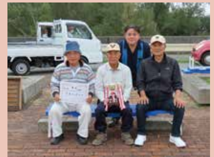
優勝した川田チーム