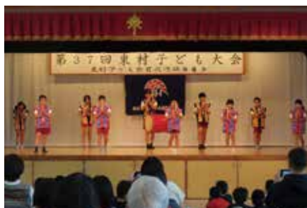
第37回東村子ども大会