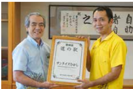
サンライズひがし道の駅登録