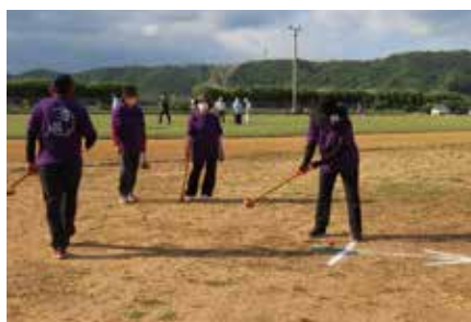
教育長杯グラウンドゴルフ大会