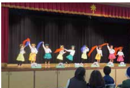
保育所生活発表会