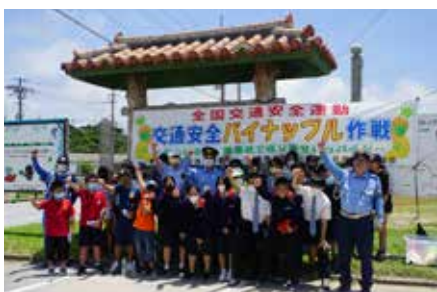
交通安全パインアップル作戦