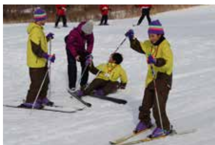
交流の翼 八幡訪問