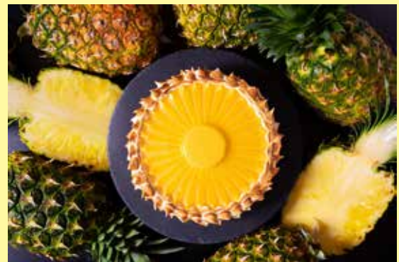
パインアップルの断面図をイメージした「ゴールドバレルパインタルト」