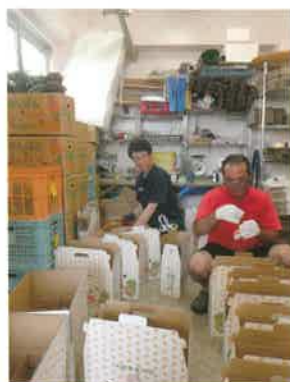
道の駅ふるさと納税 発送準備