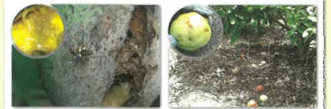
平成14年5月～8月、豊見城市、那覇市、糸満市でミカンコミバエが再発生しました。

これはミカンコミバエを防除するための誘殺板(テックス板)です。誘殺板にはミカンコミバエのオス成虫を誘引する物質と少量の殺虫剤がしみ込ませてあり、オス成虫が誘殺されます。誘殺板は住宅地域の庭木や街路樹に吊り下げて設置します。誘殺板を設置することで、ミカンコミバエの再発生を防ぐことができます。※口に入れなければ人体に害はありません。