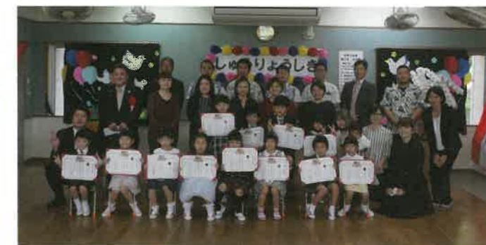
東村立東幼稚園 卒園式