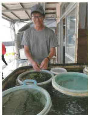
海ぶどう選別作業