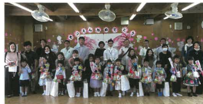
東村立東保育所 卒園式