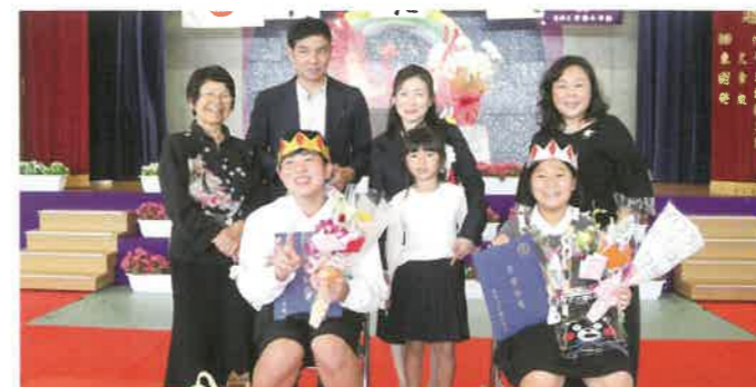
東村立有銘小学校 卒業式