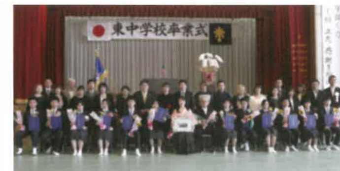
東村立東中学校 卒業式