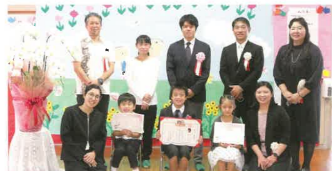
東村立有銘幼稚園 卒園式