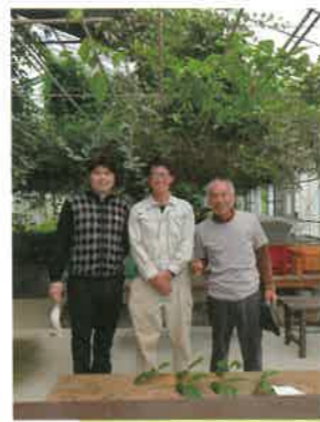
又吉コーヒー園さんと