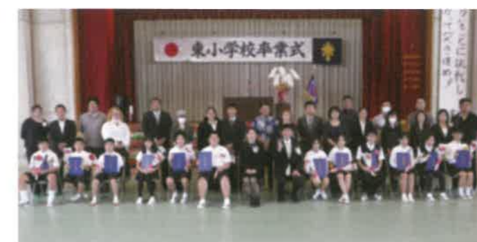
東村立東小学校 卒業式