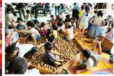
木のタマゴのプール