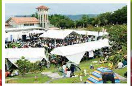
多くの来場者で賑わう村民の森つつじ エコパーク