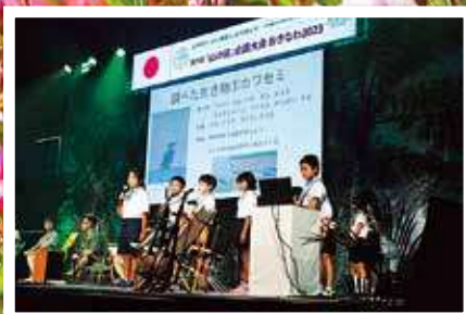
【記念行事】有銘小児童による自然環境の取組発表