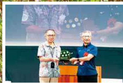
【式典】玉城デニー知事より次期開催地東京都へ山の日帽引継ぎ