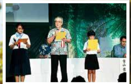
【式典】歓迎挨拶を述べる當山村長