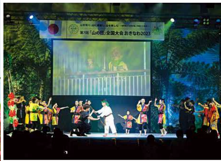
【式典】オリジナル創作劇