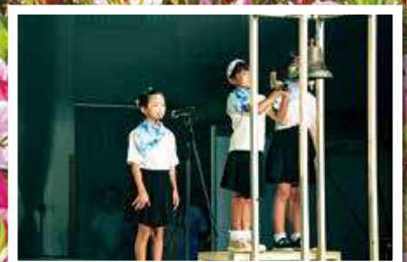
【式典】有銘小児童による山鐘（8点鐘）