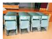
宮城区 折りたたみイス