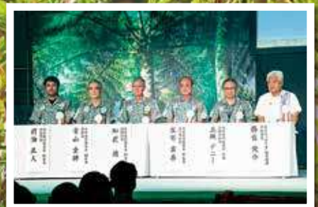
【式典】開催地首長等