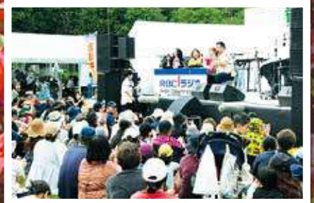
RBC-iラジオによる公開生放送