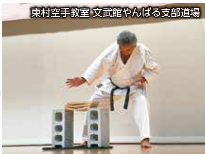
東村空手教室 文武館やんばる支部道場