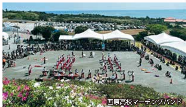
西原高校マーチングバンド