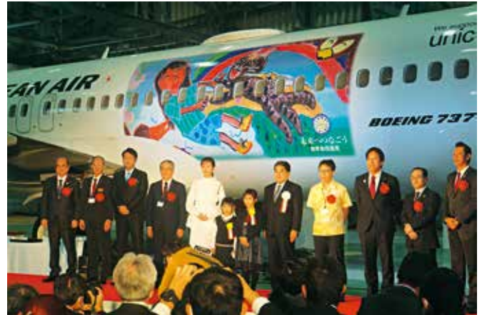
関係者登壇による特別機のお披露目