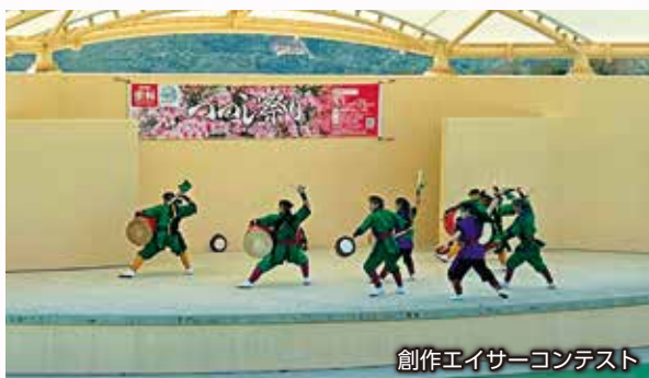
創作エイサーコンテスト