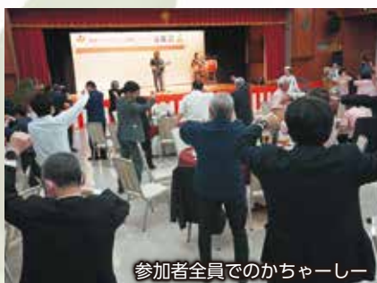
参加者全員でのかちゃーシー