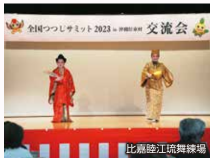
比嘉睦江琉舞練場