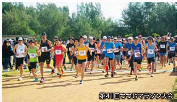
第41回つつじマラソン大会